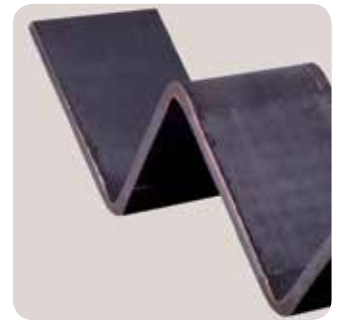
1 Estación permanente de plegado conforme a la normativa CE.