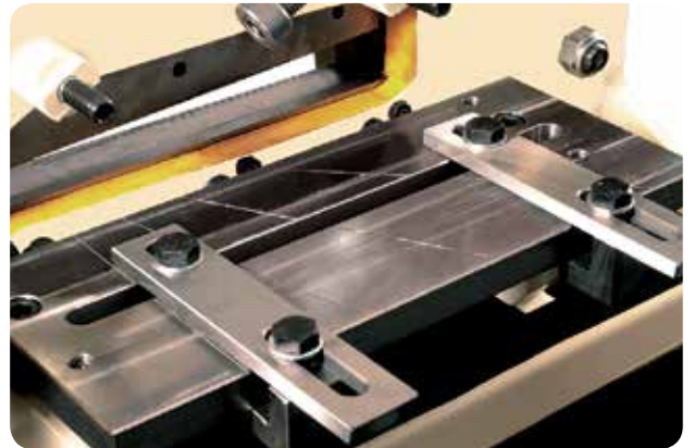
3 Con el objetivo de eliminar las deformaciones permanentes que se producen en el material en el momento del corte, la serie BENDICROP está dotada, de forma exclusiva, de un SISTEMA DE CORTE DE LLANTAS SIN DEFORMACIÓN. Este sistema está especialmente diseñado para cortar materiales blandos (cobre, aluminio...) obteniendo calidades de corte excepcionales.